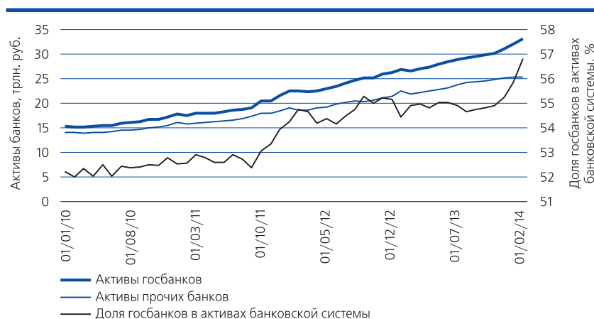
Рис. 1. Динамика активов государственных и прочих банков и доля госбанков в активах