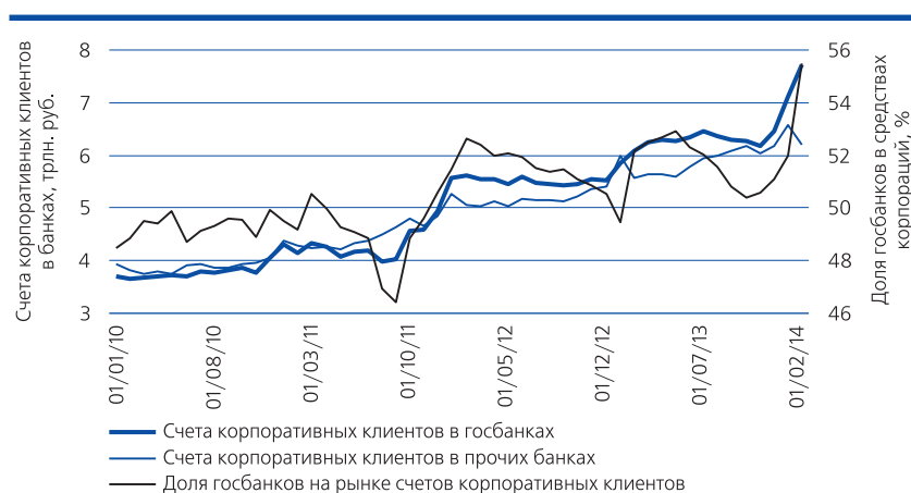
Рис. 4. Динамика счетов корпоративных клиентов в государственных и прочих банках и доля госбанков в средствах корпораций