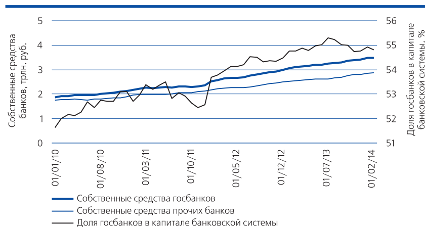
Рис. 2. Динамика собственных средств* государственных и прочих банков и доля госбанков в капитале

* — Рассчитано по балансовым счетам (форма № 101).