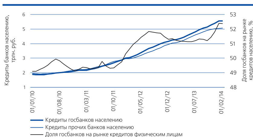
Рис. 5. Динамика кредитов населению государственных и прочих банков и доля госбанков в кредитах физическим лицам