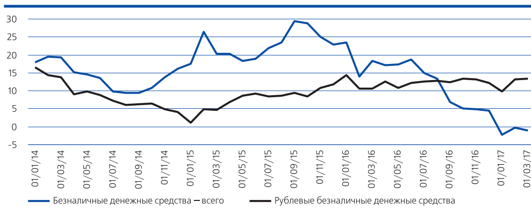
Рис. 1. Темпы прироста безналичных денежных средств, в % к соответствующей дате предыдущего года

сы, происходившее в начале года, было компенсировано уже по итогам второго его месяца. В период финансовой нестабильности 2014–2016 гг. за первые два месяца года сокращение объема безналичных рублевых денежных средств составляло от 1,2 до 2,8%. В эти годы к сезонному фактору добавлялся де-